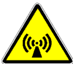
RADIAZIONI NON IONIZZANTI

E' fatto divieto al personale non autorizzato di accedere ai succitati locali. Le modalità di accesso del personale dell'impresa devono essere concordate con il responsabile della struttura, il responsabile dell'attività di ricerca di laboratorio e l'Esperto Qualificato.